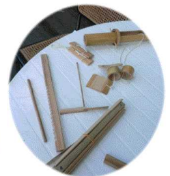
←懐かしい竹鉄砲 で遊ぶ子どもたち