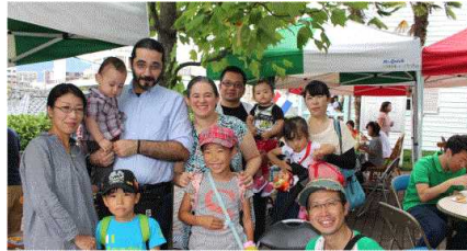
↑お客さんも多国籍で 国際色豊かでした→